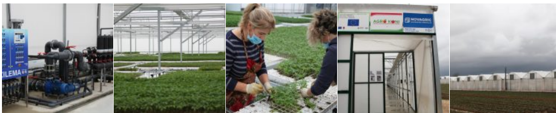
Foto nga investimi

( https://azhbr.gov.al/content/uploads/2021/03/IMG_3188-1024x602.jpg )