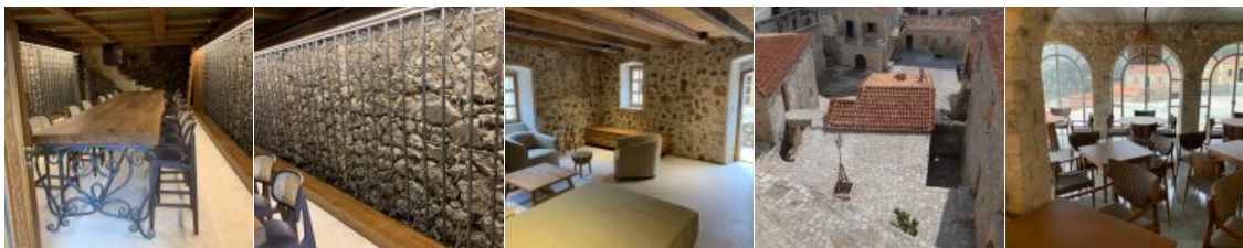
Foto nga investimi

( https://azhbr.gov.al/content/uploads/2021/03/Coast-to-Coast-1-1024x768.jpeg )