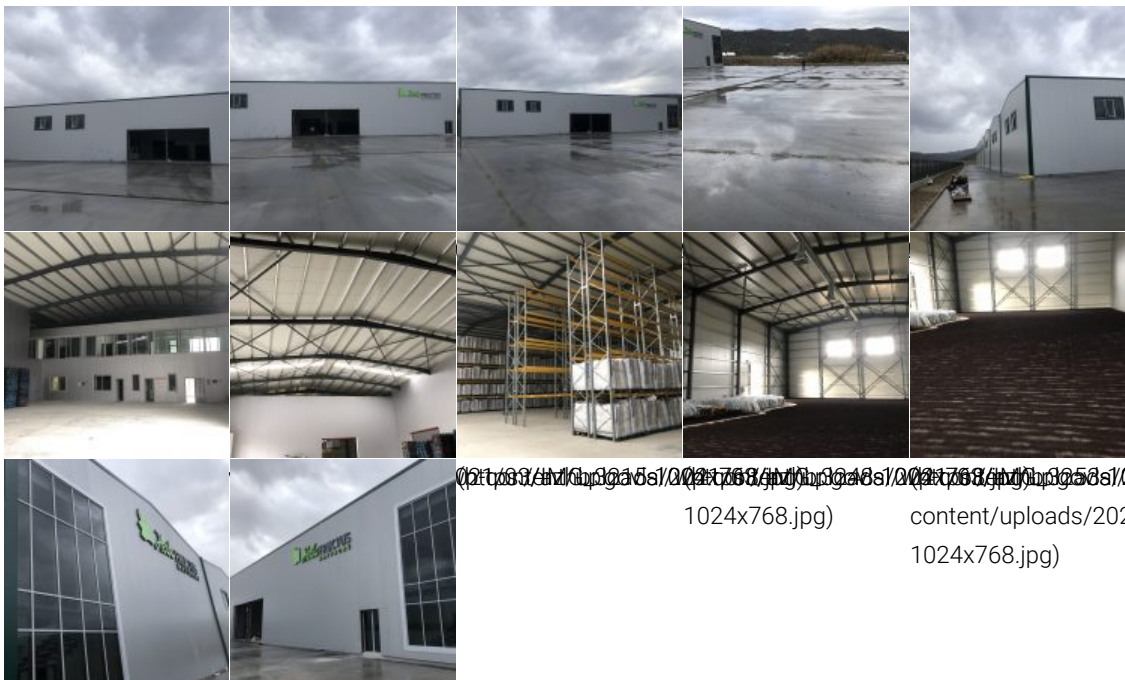
Foto nga investimi

Kompania Herba Fructus Natyore shp" Investon në ngritjen e nje magazine me sipërfaqe 7,068 m2. Kjo magazinë do të ndërtohet në parcelën nr. 3764 me nr. Pasurie 315/1/1, e cila është në pronësi të kompanisë dhe që ndodhet në fshatin Vidhas, Elbasan. Përmasat e magazinës do të jene 69 x 119.8 m dhe lartësia 10.66 m.