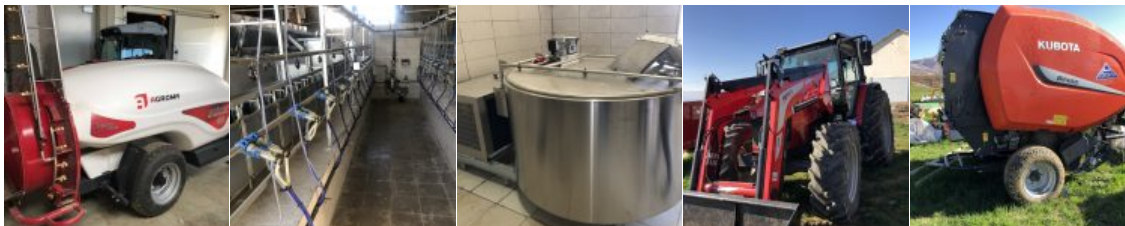
Foto nga investimi

( https://azhbr.gov.al/content/uploads/2022/07/Green-revolution-16-1024x768.jpg )