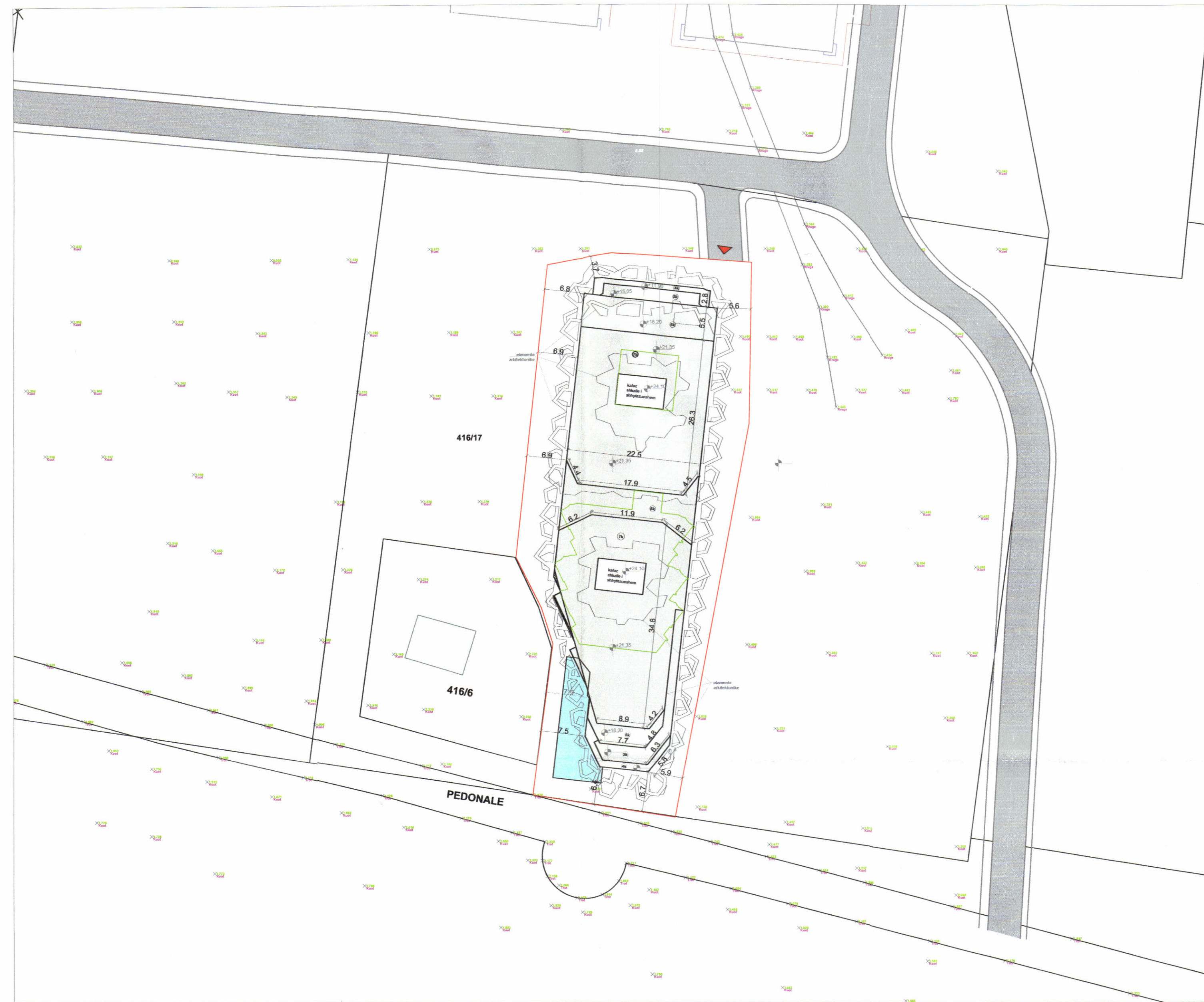
PLANI I VENDOSJES SË STRUKTURËS SHK. 1: 500