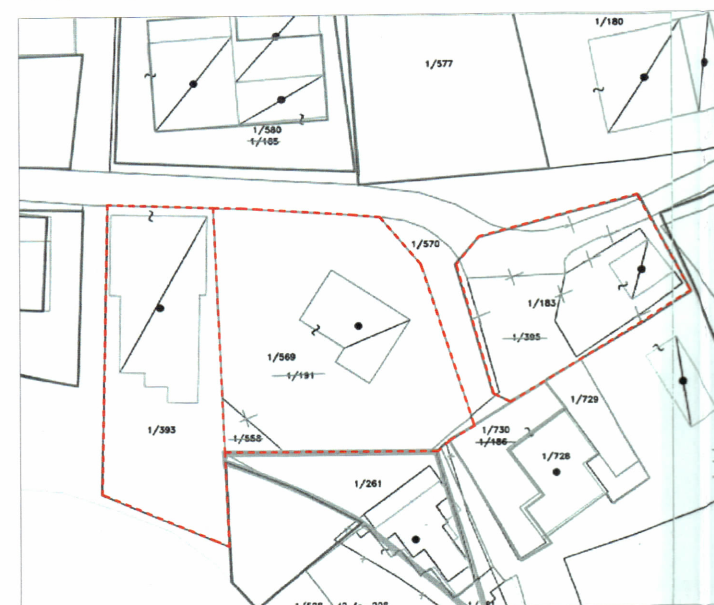
POZICIONI KADASTRAL SHK. 1:500